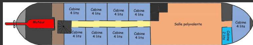
NIVEAU DE SOLE

une grande salle lumineuse de 45 m2 pour les loisirs, les repas, les réunions, le travail, la détente et dix cabines de 2 à 4 lits (superposés par 2) pouvant accueillir jusqu'à 38 passagers