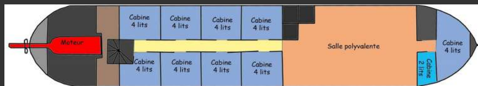
NIVEAU DE SOLE

une grande salle lumineuse de 45 m2 pour les loisirs, les repas, les réunions, le travail, la détente et dix cabines de 2 à 4 lits (superposés par 2) pouvant accueillir jusqu'à 38 passagers